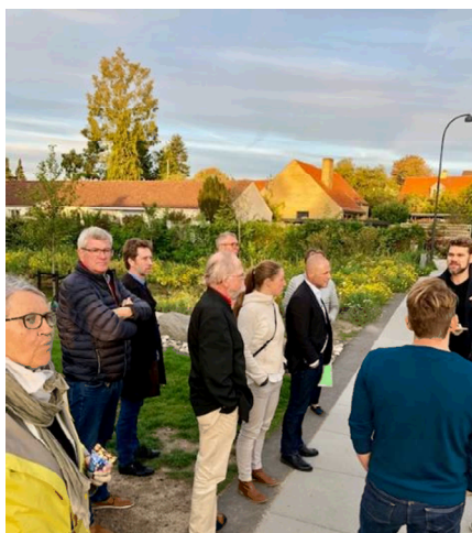
Fotos: Medlemmer af opgaveudvalget Det grønne Gentofte på indledende ekskursion.