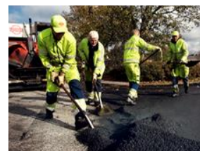
Det er vigtigt, at afspærringen ikke flyttes eller fjernes, da den er der både for at beskytte de folk, der arbejder på stedet og trafikanterne i området og for at undgå, at du og dine kæledyr får sorte poter