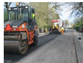
Flyt din bil imens arbejder pågår, der er ikke plads til den, når maskinerne kommer

Arbejdet udføres af Asfaltfirmaet Pankas A/S