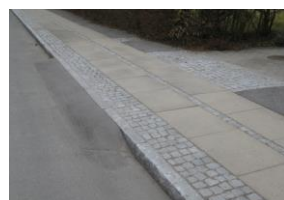
Din rampe består af to lag, en bærende kerne og et fint slidlag som udlægges i to arbejds-gange, og derfor kan der mangle et par cm, indtil slidlaget er kommet på.