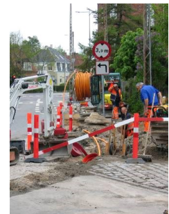
Det er vigtigt at afmærkningen ikke flyttes eller fjernes, da den er der både for at beskytte de folk, der arbejder på stedet, og trafikanterne i området