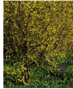
Cornus mas – Kirsebærkornel. Løvfældende busk med særlig bark. Små duftende gule blomster i marts-april, som bier og insekter elsker.