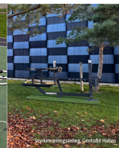
Styrketræningsanlæg, Gentofte Hallen