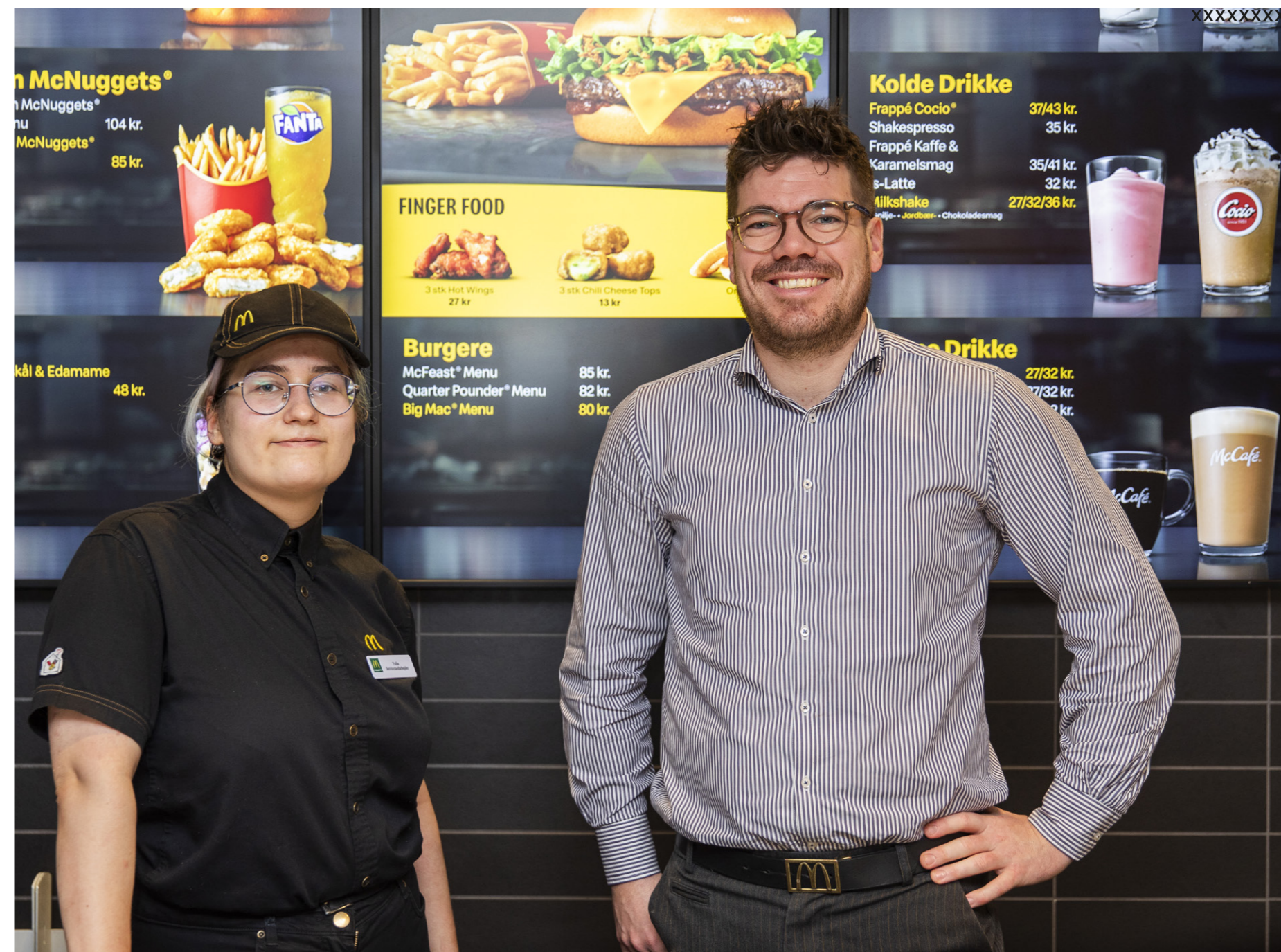
McDonald's er med til at skabe et arbejdsmiljø hvor der er plads til alle.