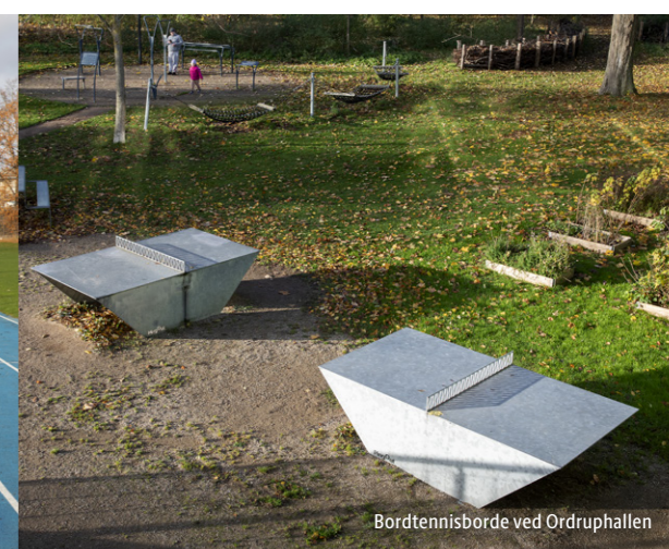
Bordtennisborde ved Ørdruphallen