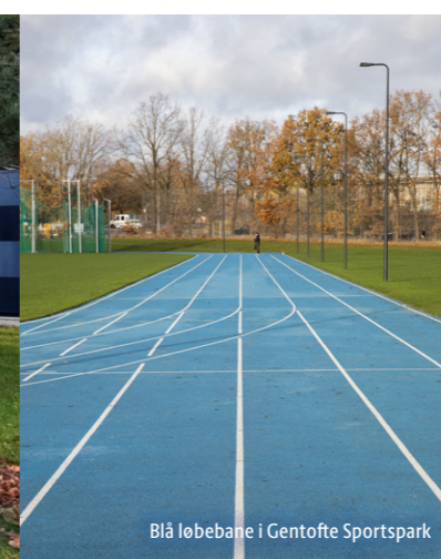
Blå løbebane i Gentofte Sportspark