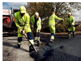
Det er vigtigt, at afspærringen ikke flyttes eller fjernes, da den er der både for at beskytte de folk, der arbejder på stedet og trafikanterne i området og for at undgå, at du og dine kæledyr får sorte poter