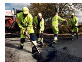
Det er vigtigt, at afspærringen ikke flyttes eller fjernes, da den er der både for at beskytte de folk, der arbejder på stedet og trafikanterne i området og for at undgå, at du og dine kæledyr får sorte poter