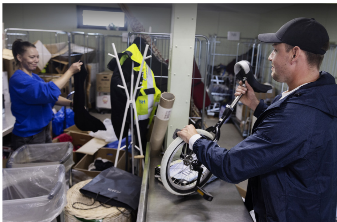
iGenbrug på genbrugsstationen tager imod dine brugte ting og sager.