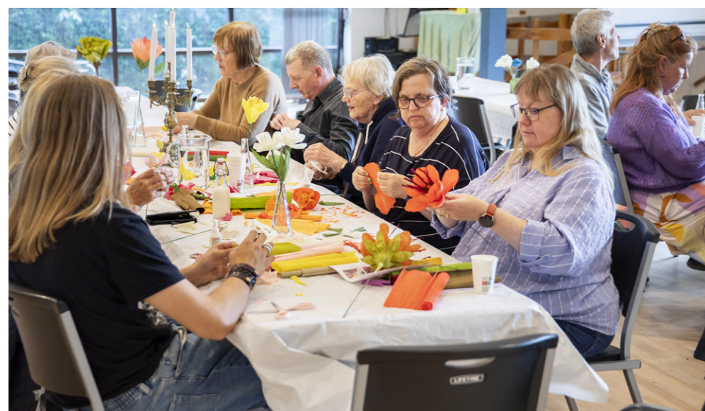
Gæster og frivillige skaber smukke blomster til fællesspisningen. Senere vil blomsterne blive brugt til kommunens andre offentlige arrangementer.