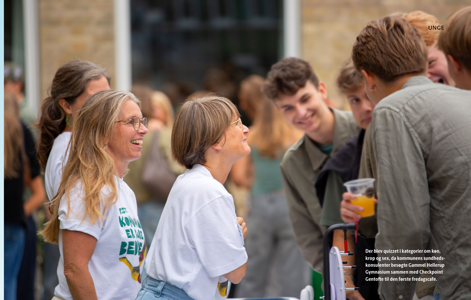
Der blev quizzet i kategorier om køn, krop og sex, da kommunens sundhedskonsulenter besøgte Gammel Hellerup Gymnasium sammen med Checkpoint Gentofte til den første fredagscafe.