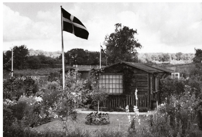
Herover: Kolonihavehus i Haveforeningen Bernstorff, foto fra begyndelsen af 1930'erne. Til venstre: Fest i haveforeningen Solvang med blandt andet tombola og bar, foto fra ca. 1940.