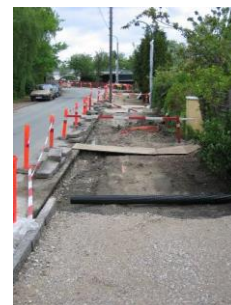
Du vil altid få mulighed for gående adgang til din ejendom