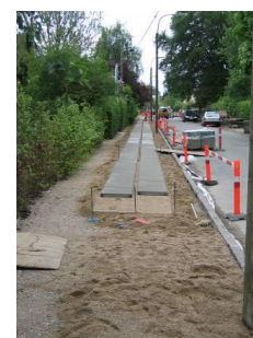
Det er ikke muligt at køre ind på din grund, imens fortovet udføres, da det vil ødelægge entreprenørens arbejde og din bils undervogn

Arbejdet udføres af Brolægger Kompagniet A/S