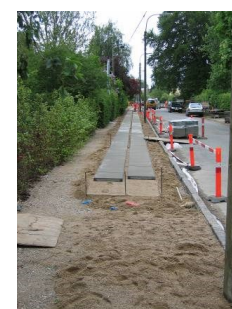
Det er ikke muligt at køre ind på din grund, imens fortovet udføres, da det vil ødelægge entreprenørens arbejde og din bils undervogn

Arbejdet udføres af Brolæggerfirmaet Lindrand A/S