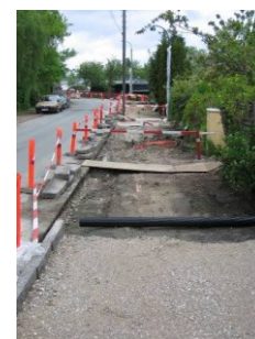
Du vil altid få mulighed for gående adgang til din ejendom