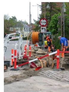
Det er vigtigt at afmærkningen ikke flyttes eller fjernes, da den er der både for at beskytte de folk, der arbejder på stedet, og trafikanterne i området

Brand og politi orienteres om arbejdet, og vi sørger for, at de kan komme frem, hvis det bliver aktuelt.