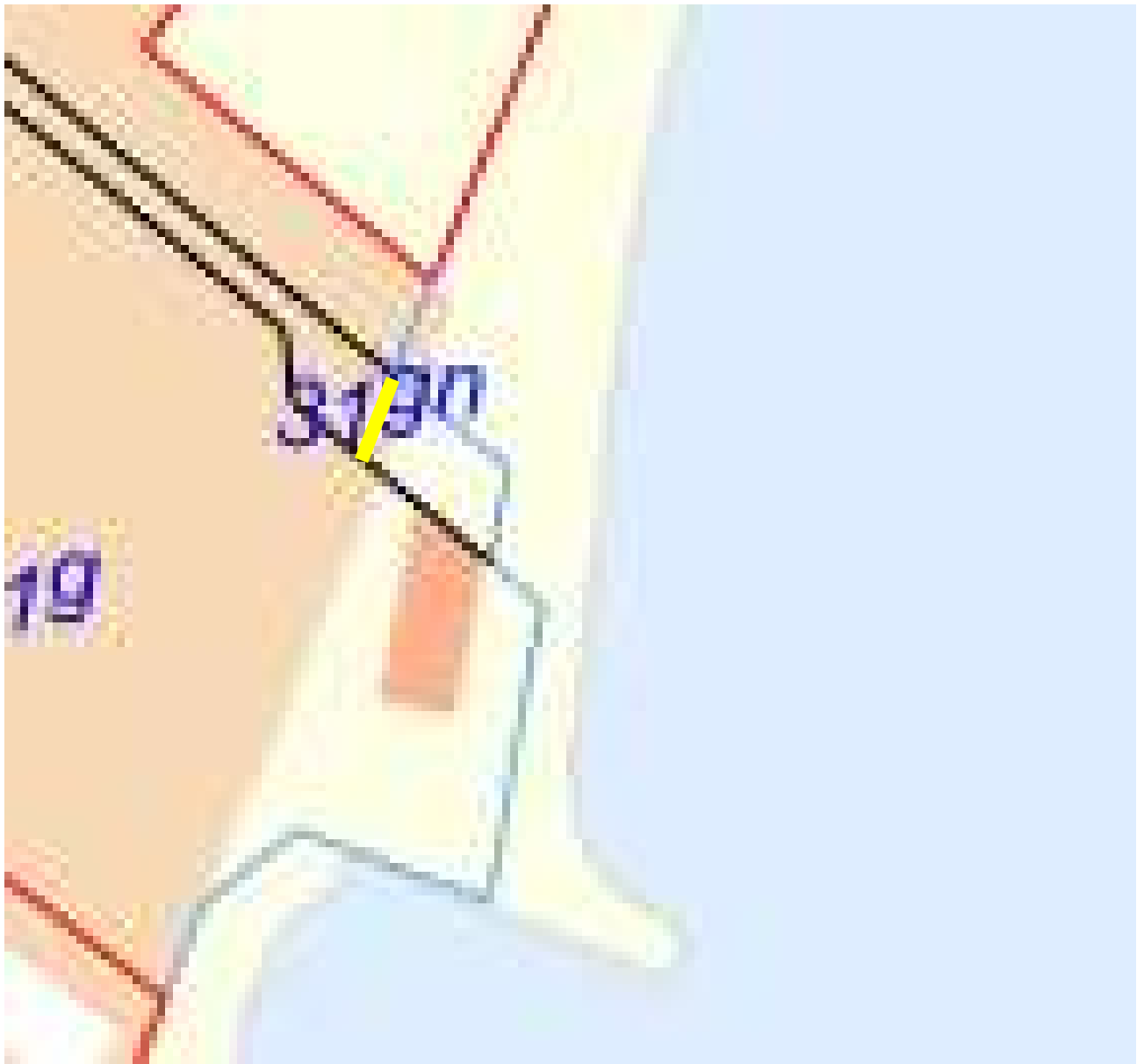
Matr. 31gn - PLACERING AF EKSISTERENDE MUR MARKERET MED GULT