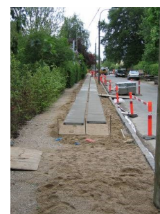
Det er ikke muligt at køre ind på din grund, imens fortovet udføres, da det vil ødelægge entreprenørens arbejde og din bils undervogn

Arbejdet udføres af Brolæggerfirmaet Lindrand A/S